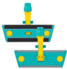
Telaio sistema velcro con Block System