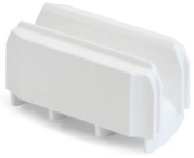
Giunto per Max